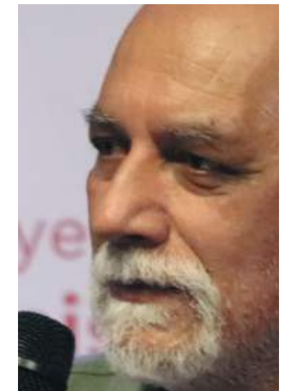
Maestro peruano Miguel Rubio